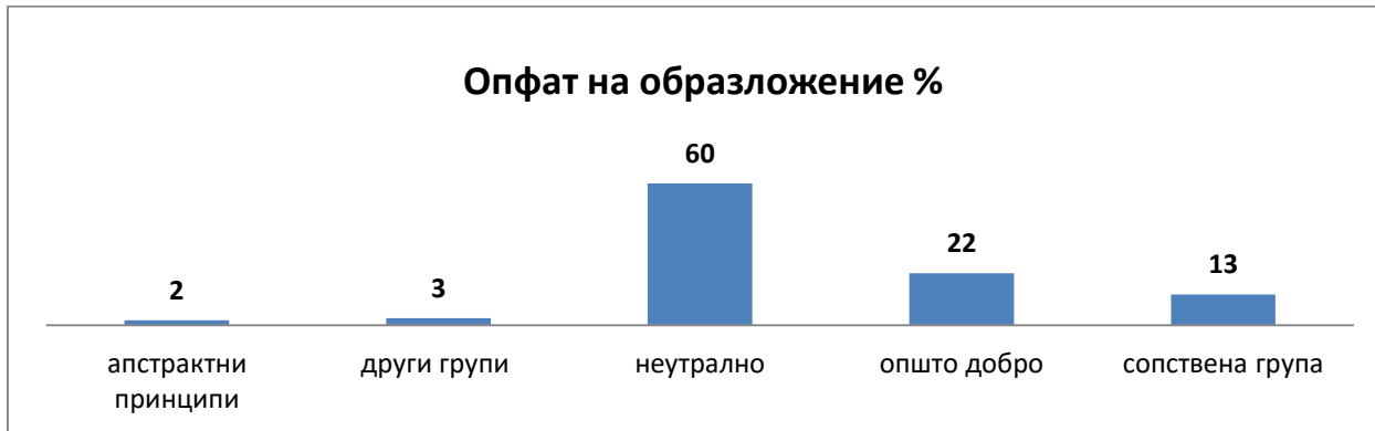
Графикон 3: Опфат на образложение

Во набљудувањето на седниците на КЕП беше измерен и опфатот на образложението кое го даваа пријавените за збор. Највисок е процентот кај оние чие образложение било неутрално, односно 60%, додека пак во 22% од говорите образложението се однесувало на општото добро на граѓаните. За сопствената група зборувале во 13% од случаите а осврнувањето кон другите групи било застапено со 3%. Најнизок е процентот кога образложението се однесувало на апстрактни принципи со 2%.