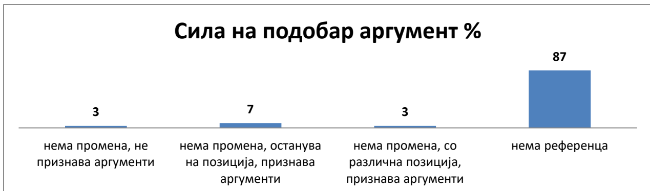
Графикон 4: Сила на подобар аргумент

Она што кај нас е честа појава е всушност неприфаќањето на аргументите на другите и промена на сопствената позиција по одредено прашање врз основа на аргумент од другата страна. Па затоа во 87% од излагањата нема референца кон аргумент на другиот. Ист е процентот - 3%, кај оние кои не признаваат аргументи и не ја променуваат својата позиција, како и кај оние кои не ја промениле својата позицијата, но сепак го признале аргументот. Во 7 % од случаите, говорниците со иста позиција, ги признале аргументите на другиот.