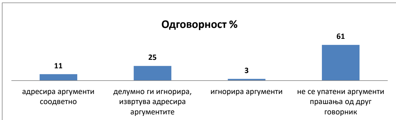
Графикон 2: Одговорност

Користејќи го правото на реплика и контра-реплика, пратениците и останатите учесници на седниците треба соодветно да одговорат на упатените аргументи од другите говорници. Тоа се случило во 11% од случаите каде аргументите се адресирани соодветно. Најголем е процентот кога учесниците во дискусиите не упатувале аргументи прашања, односно 61%, а делумно игнорирани, односно извртувани, аргументите биле во 25% од дискусиите. Најмал е процентот каде се целосно игнорирани аргументите, односно во 3%.