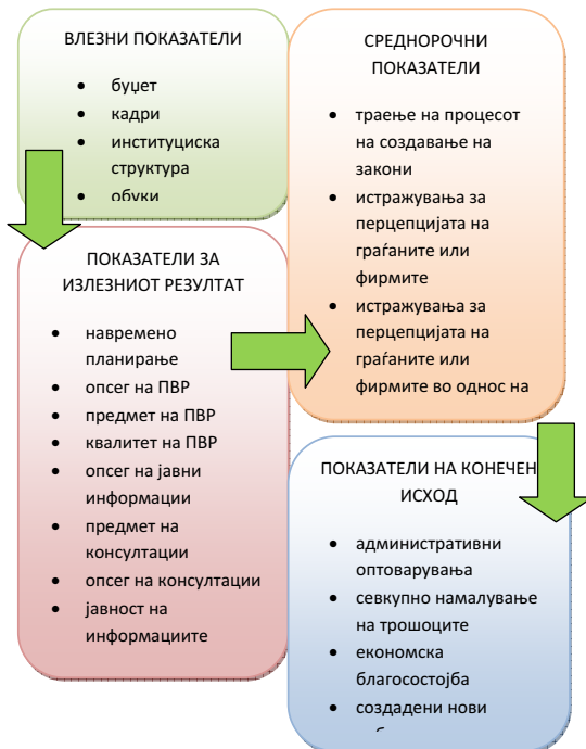
Дијаграм 2: Категории врз основа на кои можат да се извлечат показатели