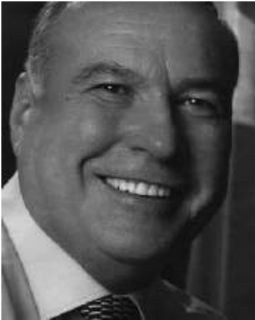
Stojan Andov, pol i ti -ar i porane{ en ambasador na SFRJ vo I rak