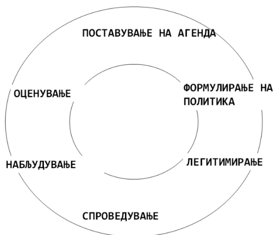
Приказ 1 Фази во циклусот на носење политики

б) Оценување - во рамки на оваа фаза се евалуира во која мерка спроведената политика ги дала потребните резултати согласно проектираните цели и решенија. Оценувањето го прават органите на јавната власт, но тоа можат да го прават и приватни ентитети (здруженијата на граѓани, приватните компании, експертите - самоиницијативно или преку делегирање). Во рамки на оваа фаза се определува и дали се потребни дополнителни акции со цел спроведување на зацртаните цели.